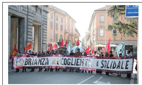
Monza, 23 marzo 2019

*Brianza accogliente e solidale è la rete delle associazioni per l'integrazione e contro ogni forma di discriminazione.